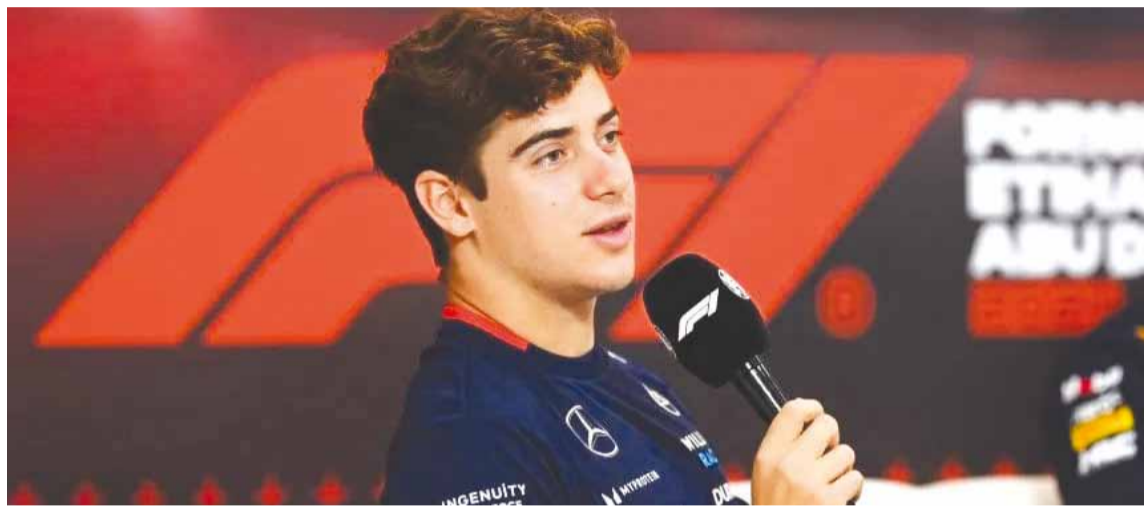
Franco Colapinto tendrá otro año arriba de un auto de Fórmula 1