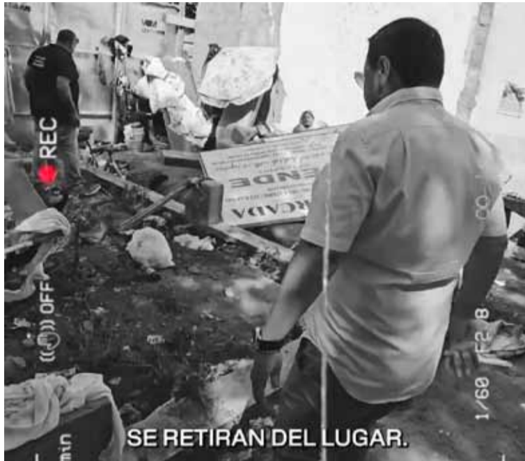
Lucha. Una imagen del video donde se ven dos operativos contra "okupas"

"Vamos, arriba, se retiran del lugar", se escucha decir al personal que comanda los operativos. Se ve cómo retiran colchones y otras pertenencias de los detenidos, y derriban una pared hecha con ladrillos para guarecerse. "Ni okupas en propiedad privada, ni fisuras en el espacio público. Basta", escribió el intendente en