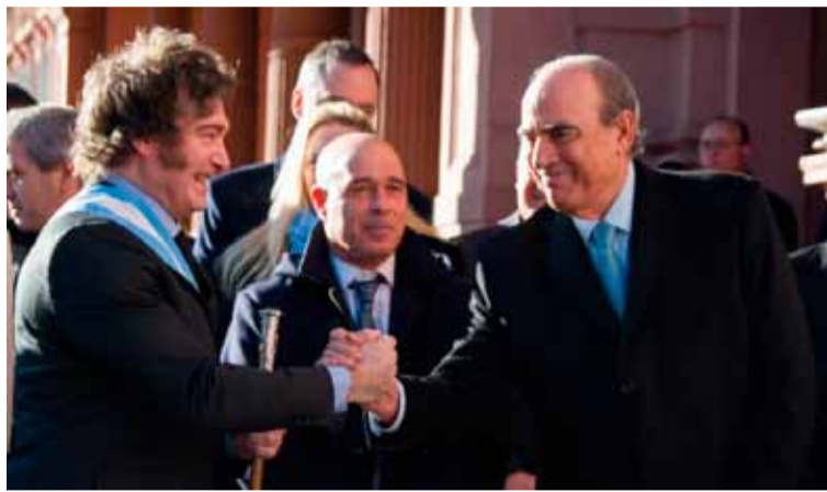
Guillermo Francos, jefe de Gabinete, junto al presidente Milei

Limpia, el proyecto que impulsa PRO para evitar que condenados en segunda instancia por causas de corrupción se postulen a cargos electivos, también entraría en el temario.