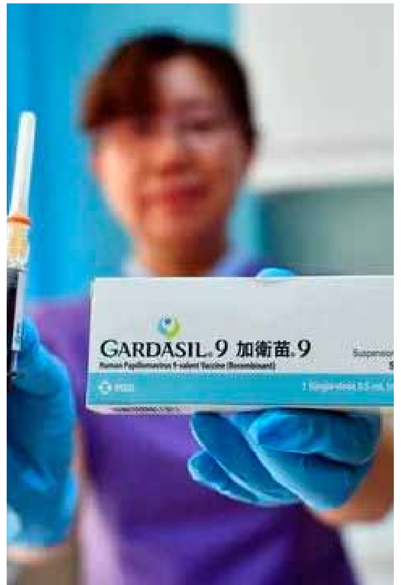
Una enfermera. Presenta una vacuna contra el papiloma humano

China hizo más esfuerzos para ampliar su apertura en el campo médico, atrayendo a más gigantes farmacéuticos globales como Merck para incursionar en el prometedor mercado. En septiembre de 2024, China anunció que agregaría exenciones a los aranceles de importación y al impuesto al valor agregado para medicamentos y dispositivos médicos elegibles en una zona piloto médica especial en la provincia de Hainan antes de 2025.///