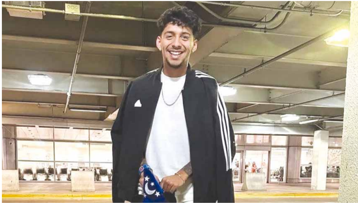
Medina finalmente será jugador de Estudiantes de La Plata

Al igual que Muniain hace seis meses, el mediocampista vasco revoluciona el mercado de pases del fútbol argentino