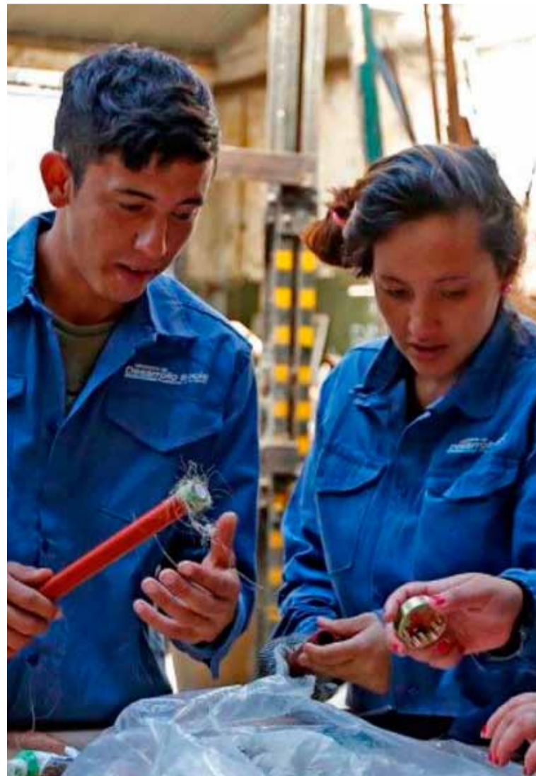
Crece el empleo, según el Gobierno

Considerando la inflación del 2,4% registrada en noviembre, “el salario de los trabajadores estables superó la inflación en 0,4 puntos”.