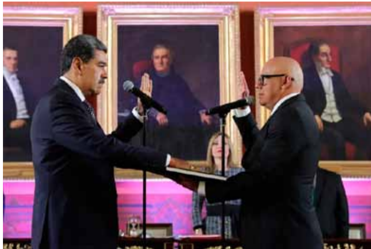
Juramento. De Nicolás Maduro ante la Asamblea Nacional

El líder opositor Edmundo González Urrutia acusó este viernes al presidente Nicolás Maduro de «consumar un golpe de Estado» con su investidura para un tercer mandato conse-