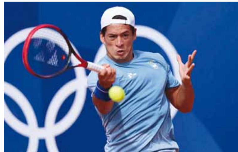
Báez debuta hoy en Australia

Por último, entre las principales candidatas a quedarse con el título se encuentra la estadounidense Coco Gauff (3°) se medirá ante su compatriota Sofia Kenin (81°).